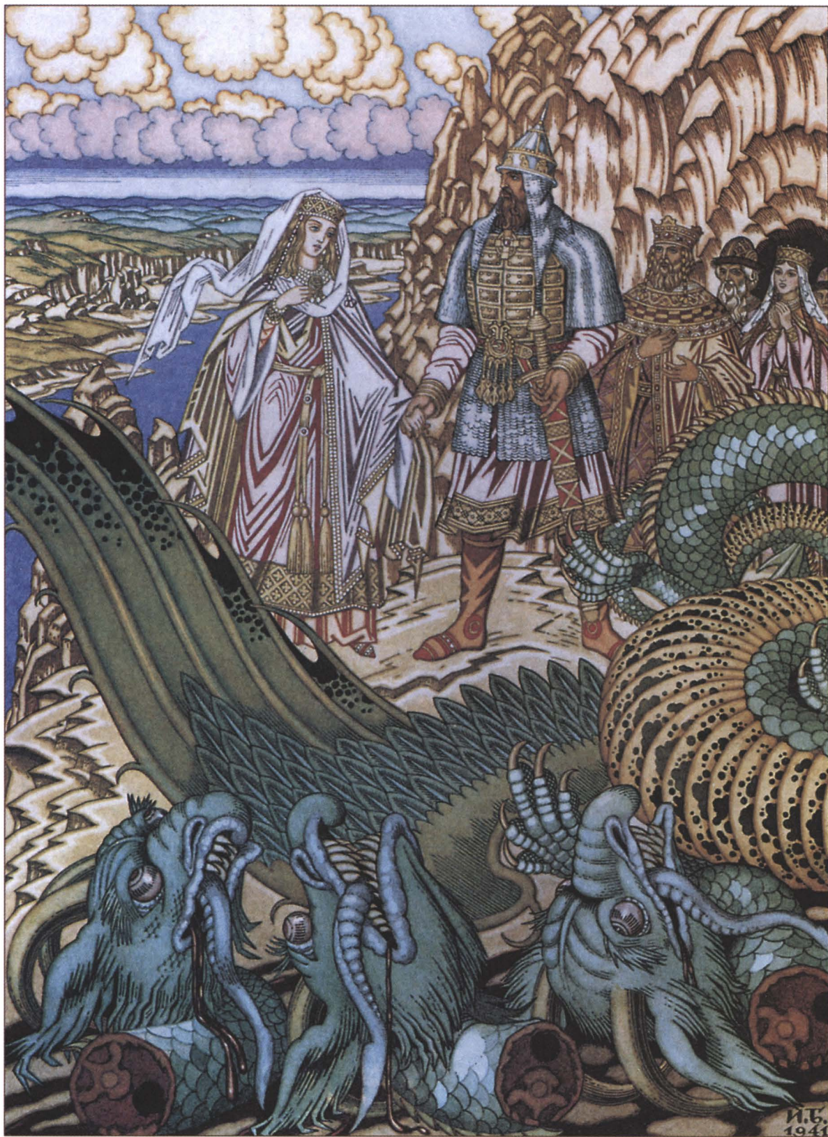
И. Билибин. Добрыня Никитич и Забава Путятинна