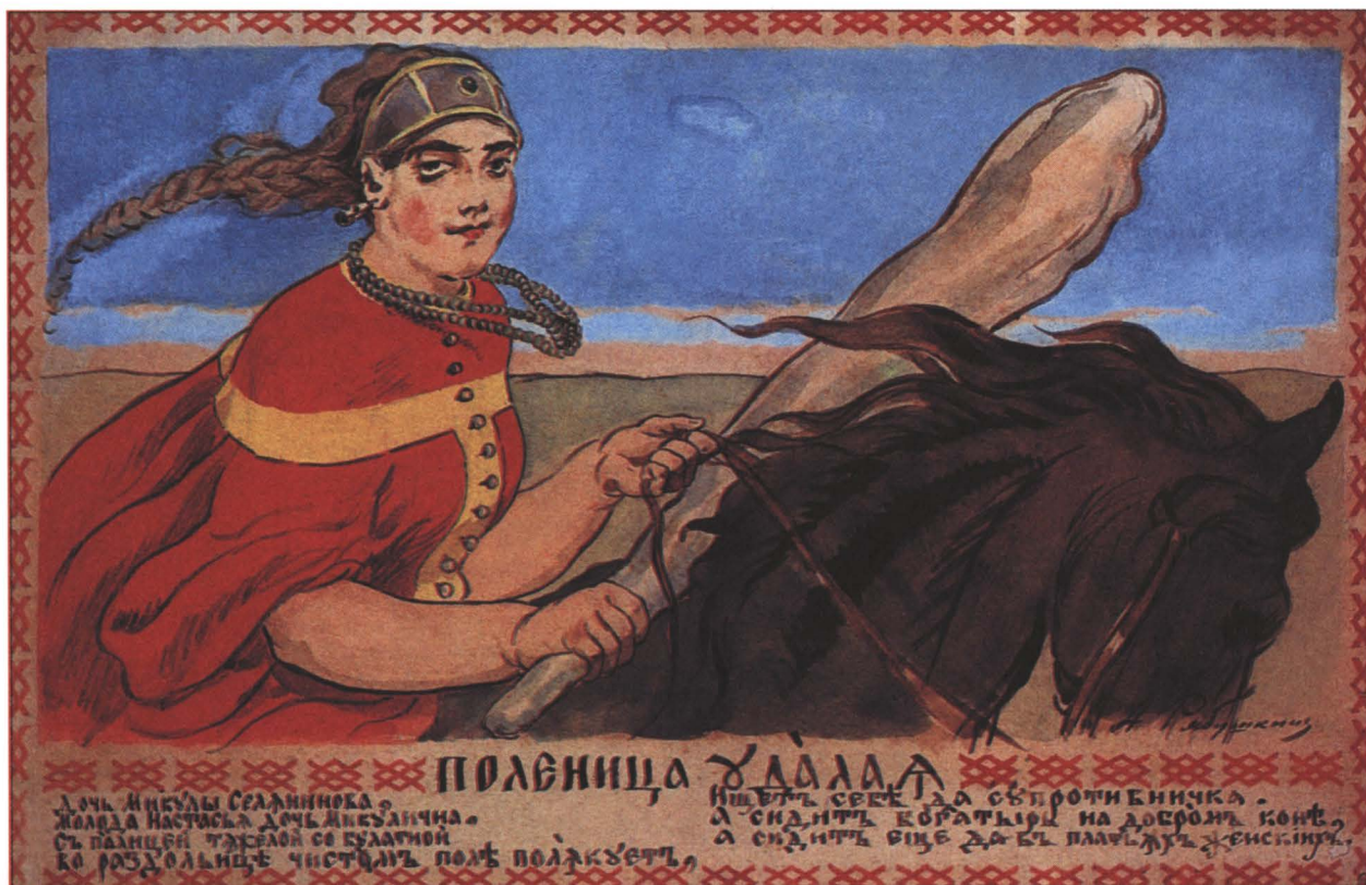
А. Рябушкин Настасья Микулична

Царьград — так в русских сказаниях называли Константинополь, столицу Византии (ныне — город Стамбул в Турции).